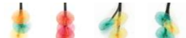
1. ORANGE ÉMERAUDE JAUNE 2. ROUGE CYCLAMEN MAGENTA 3. JAUNE ÉMERAUDE JAUNE 3. ÉMERAUDE JAUNE ÉMERAUDE