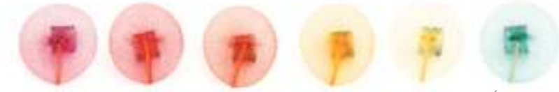
1. CYCLAMEN 2. MAGENTA 3. ROUGE 4. ORANGE 5. JAUNE 6. ÉMERAUDE