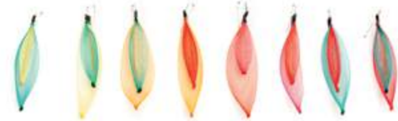
1. ÉMERAUDE JAUNE 2. JAUNE ÉMERAUDE 3. ORANGE ÉMERAUDE 4. ORANGE MAGENTA 5. ROUGE CYCLAMEN 6. CYCLAMEN ROUGE 7. ÉMERAUDE MAGENTA 8. MAGENTA ÉMERAUDE