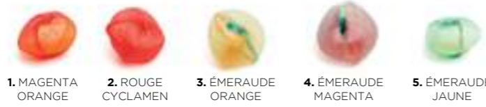
1. MAGENTA ORANGE 2. ROUGE CYCLAMEN 3. ÉMERAUDE ORANGE 4. ÉMERAUDE MAGENTA 5. ÉMERAUDE JAUNE