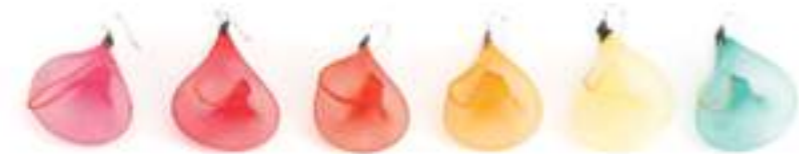
1. CYCLAMEN 2. MAGENTA 3. ROUGE 4. ORANGE 5. JAUNE 6. ÉMERAUDE