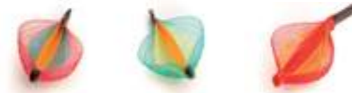
1. MAGENTA ÉMERAUDE ORANGE 2. ÉMERAUDE JAUNE ORANGE 3. MAGENTA ORANGE MAGENTA