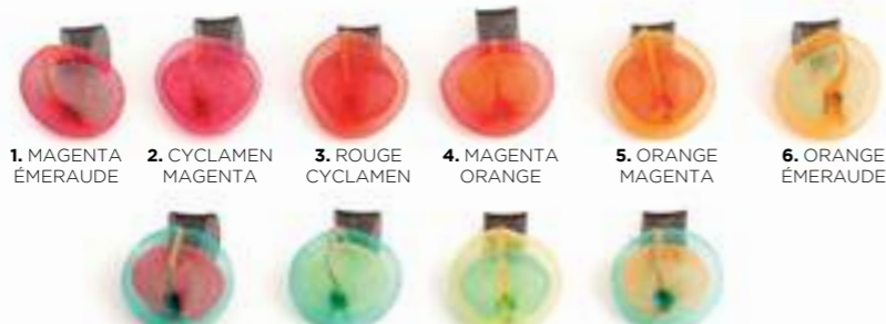
1. MAGENTA ÉMERAUDE 2. CYCLAMEN MAGENTA 3. ROUGE CYCLAMEN 4. MAGENTA ORANGE 5. ORANGE MAGENTA 6. ORANGE ÉMERAUDE 7. ÉMERAUDE MAGENTA 8. ÉMERAUDE JAUNE 9. JAUNE ÉMERAUDE 10. ÉMERAUDE ORANGE