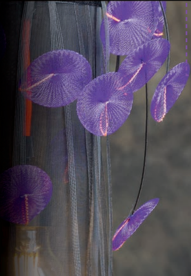
TUBE PLEINE LUNE